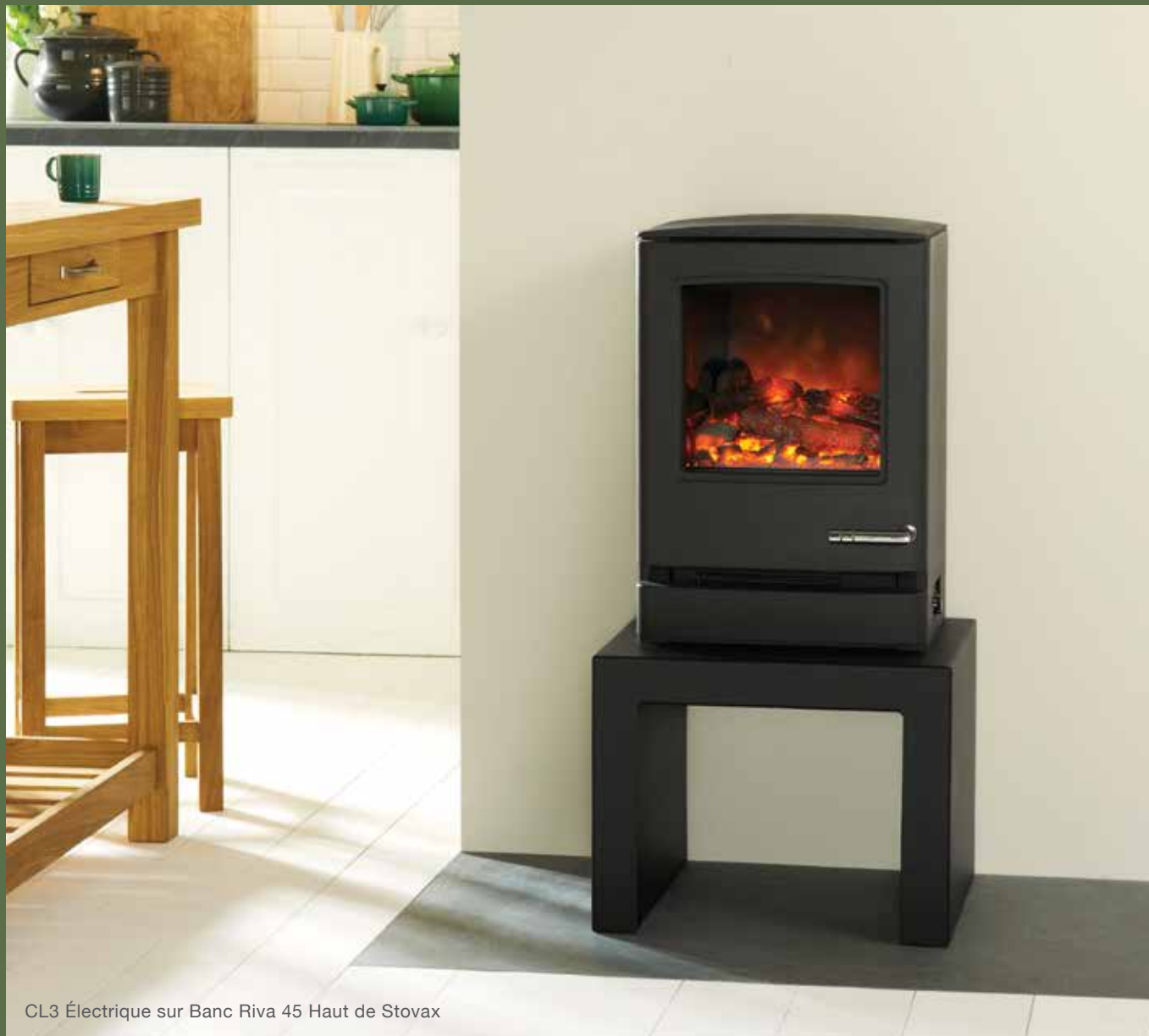
CL3 Électrique sur Banc Riva 45 Haut de Stovax